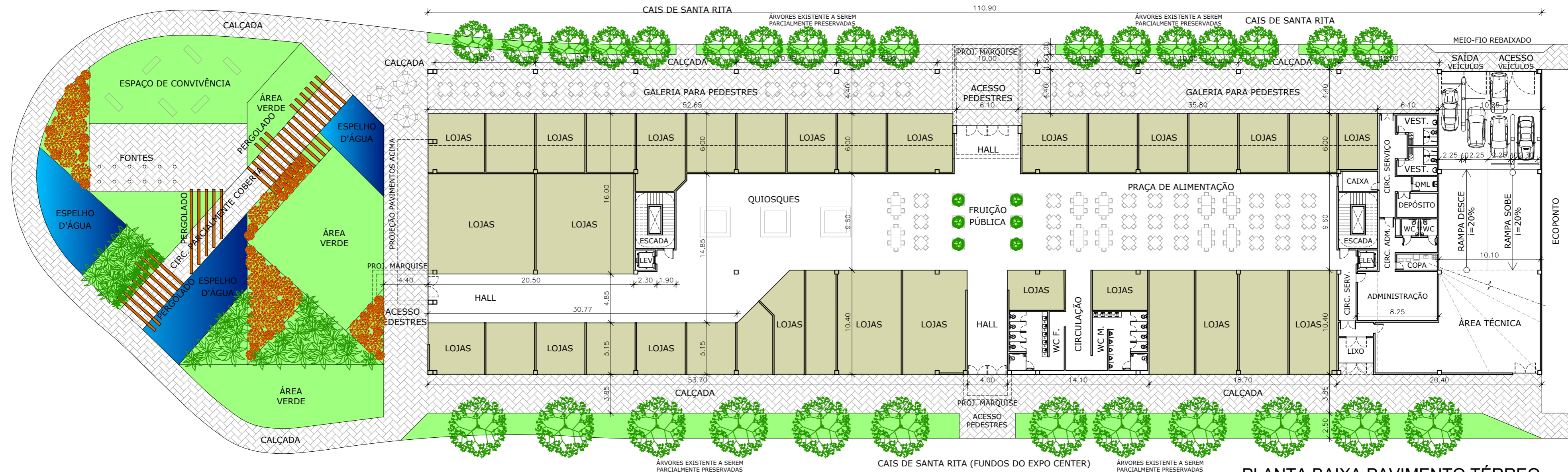
PLANTA BAIXA PAVIMENTO TÉRREO ESC. 1/300