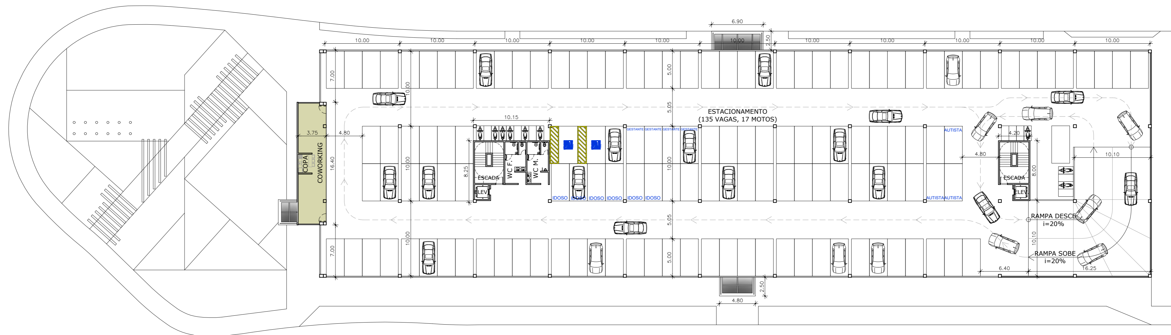
PLANTA BAIXA 1º, 2º E 3º PAVIMENTOS ESC. 1/300