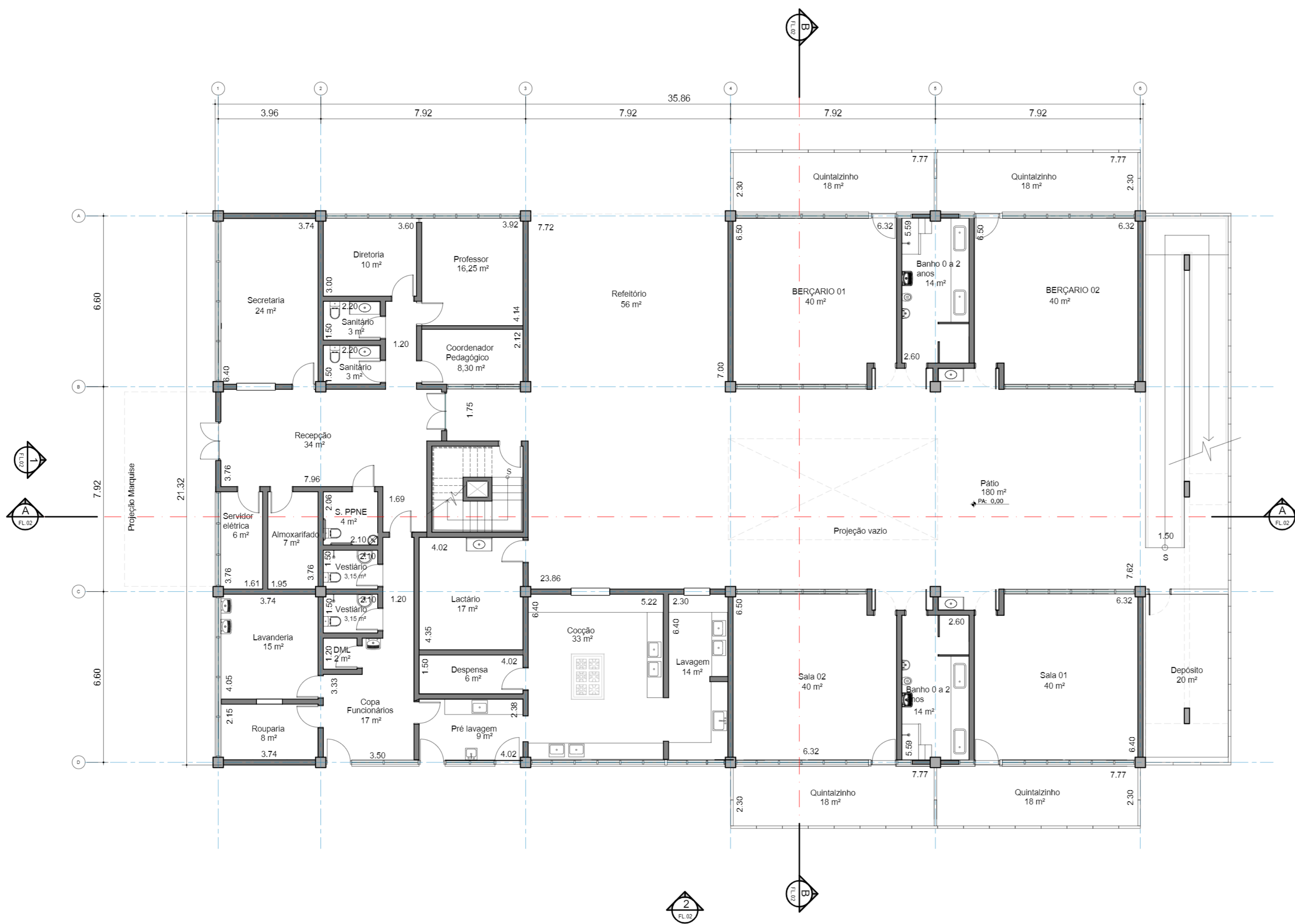
1 PAV. TÉRREO 1 : 100